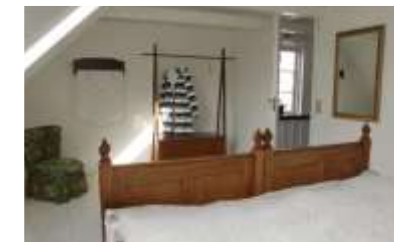
Im Dachgeschoss befinden sich zwei Schlafzimmer, jeweils mit einem Doppelbett