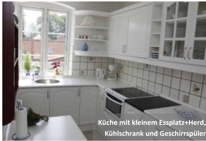
Küche mit kleinem Essplatz+Herd, Kühlschrank und Geschirrspüler