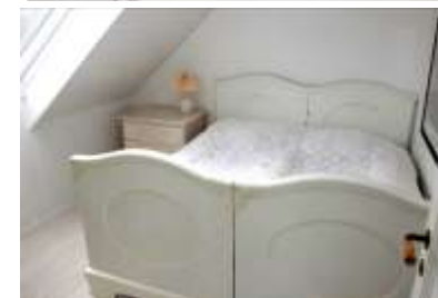
Das eine Bett ist jedoch von der kurzen Sorte... (185 cm)