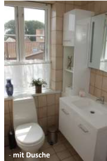
- mit Dusche