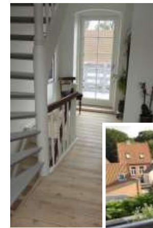
Gang im 1. Stock mit Ausgang zu südgewandtem Balkon