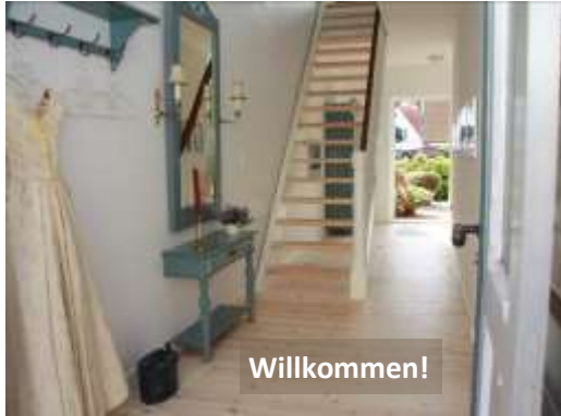
Eingangsbereich mit Toilette und Ausgang zum Atriumgarten

Das Haus ist 1870 erbaut und 2013 renoviert. Das Ferienapartment befindet sich im 1. und 2. Stock und ist ca. 90m 2 gross mit Platz für 4(6) Personen.